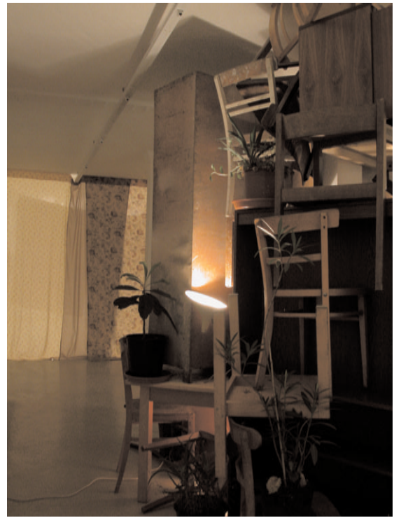
Abbildungen: Installationsansicht "Woods", 2003, Installation aus Möbeln, Lampen und Pflanzen, 300 x 300 x 250 cm