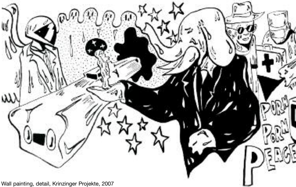
Wall painting, detail, Krinzinger Projekte, 2007