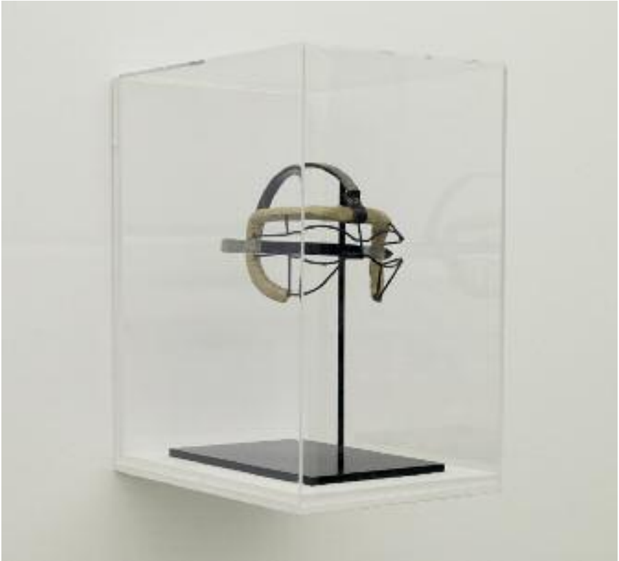
Untitled , 2003 - 2007, various materials, 35 x 25 x 30 cm, unique copy