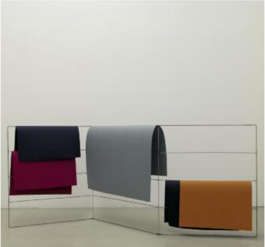
Rites à intervalles réguliers horizontal , 2007, metal, paper, 80 x 180 cm, ed. 2 + 1 AP

Rites à Intervalles Réguliers (2004-07) literally unfolds in space, either vertically or horizontally (the work exists in two versions). It consists of a metal frame draped in sheets of colored paper. The structural rigor matches the colors of the paper, while their pliability suggest a more transitory, sensitive condition. The work combines mode of presentation with what is shown – like a typological outline or initial classification, destined to be renewed or transformed.