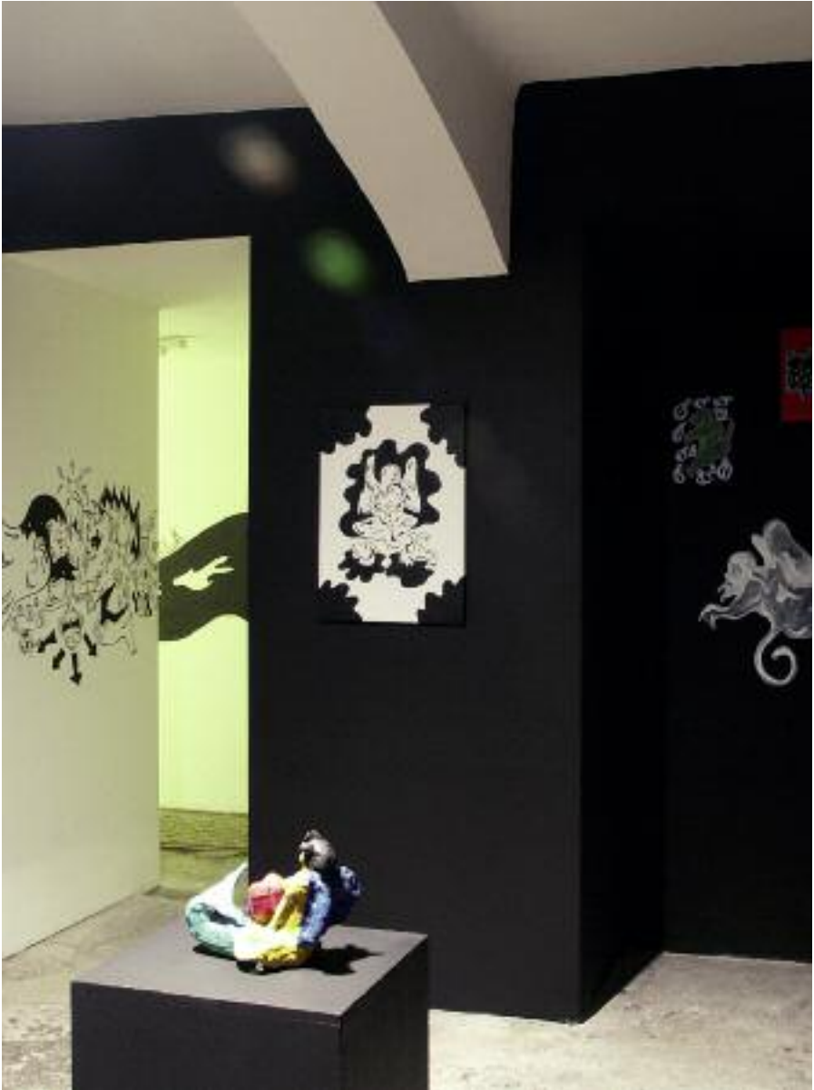
installation view: Fabien Verschaere, 2007