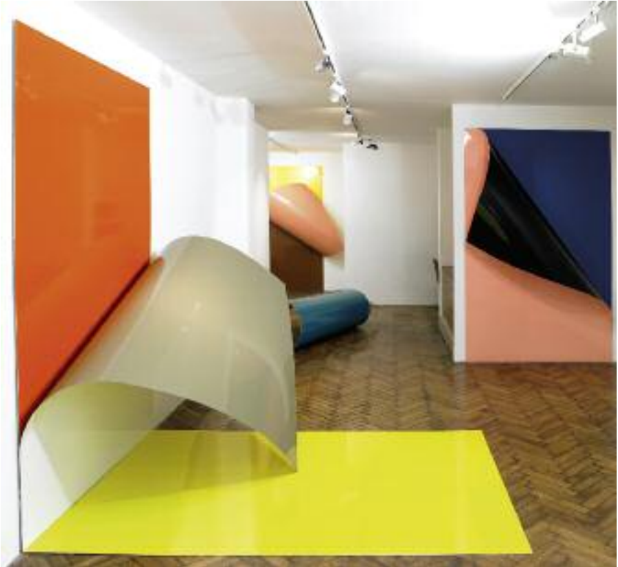
Iron Maiden , 2007, metal sheets, 270 x 180 cm each, installation view Galerie Loevenbruck, Paris, 2007