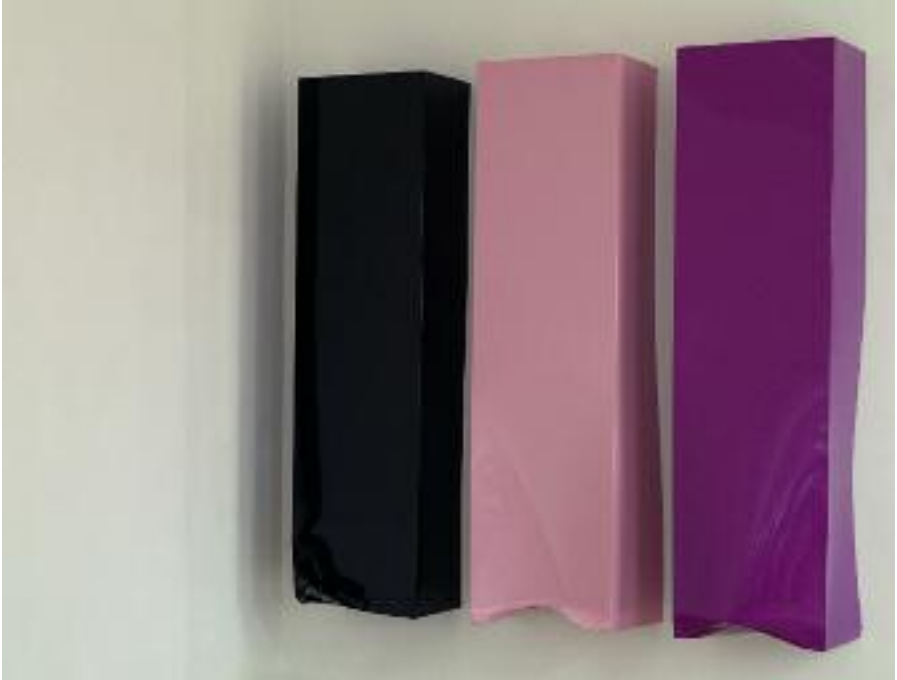
Untitled (Pale Grey California's_System Game Over) / Untitled (Cadillac California's_System Game Over) / Untitled (Flat Black California's_System Game Over), 2007, metal, 220 x 60 x 39 cm each

this progressist and exclusive vision. In fact, he physically damages the icons of perfection by making crash tests. Moreover, the minimalist works are not meant to refer to anything else than themselves, and Peinado's works are overloaded with references. He establishes unexpected connections between different elements drawn from popular culture, mass consumption or art history and then mixes all of them according to an »anti-pure« logic. Thus the artist confuses distinctions between low and high cultures, he banishes any notion of hierarchy and makes fun of conventions.