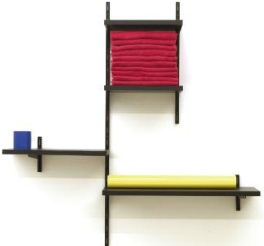
Drum and Base Lafayette , 2005, various materials, 100 x 100 x 20 cm, ed. 100

neon; or a boule welded to a steel bar). His associations enable us to discover, by analogy, signs, materials, uses and concepts, in reference to the formal organizations at the root of our individuality. His works function like mirror-instruments, telling us about the interpretative mechanisms engaged by the viewer, and the ideological forces that underpin them.