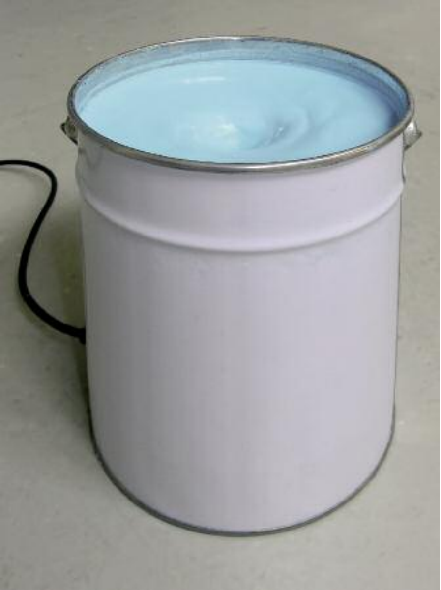
Mathieu Mercier, Pot de peinture , 1999, paint-pot and electric motor, 23 x 19 cm, ed. 5