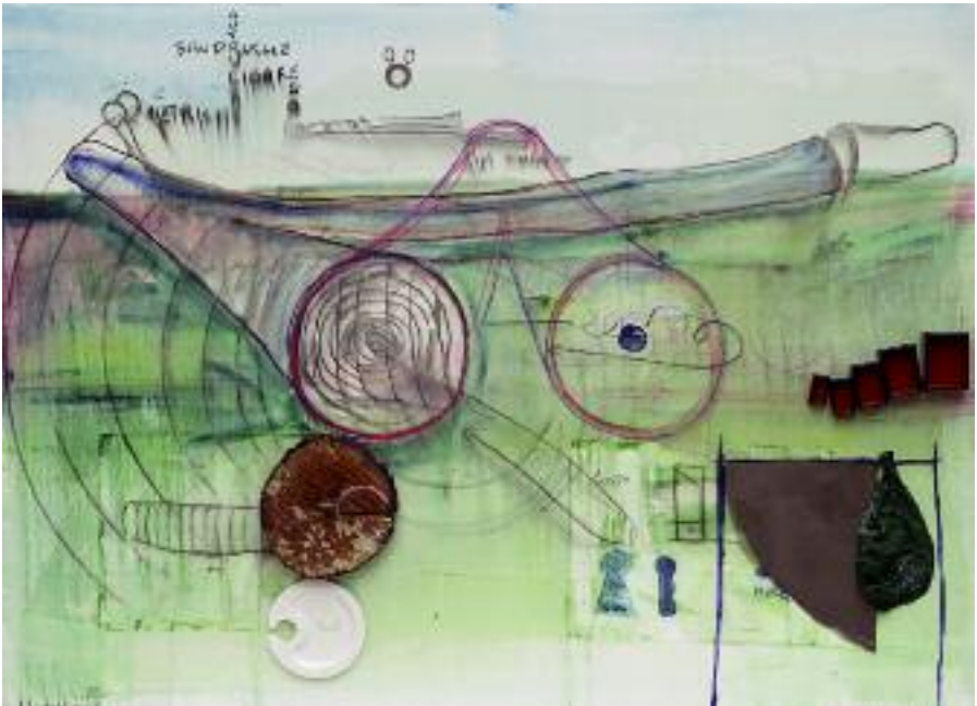
Alps revelation , 2007, mixed media on canvas, 150 x 280 cm