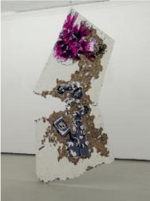
Sketch , 2006, acrylic and collage on wood, 220 x 120 x 4 cm

Details installation view opposite page (from left to right):