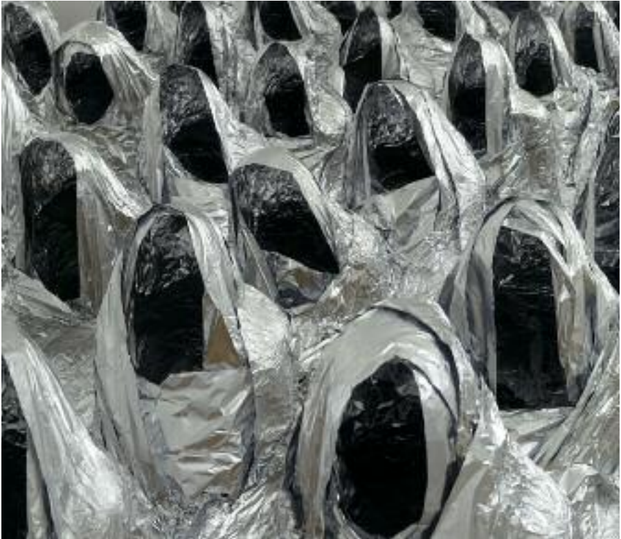
Detail of Ghost , 2007, aluminum foil, dimensions variable, ed. 3

Moreover, it questions the fragile and ephemeral aspect of Art - would it be on a formal side or on the meaning's side, and by extension of Life. The materials I use are aluminum foils. From a plastic point of view, I am guided by an important sentence to me from Lao Tseu: »Man creates things, but emptiness gives them meaning«. That's why with this work my aim is to fulfill the space with emptiness. These shapes exist with what they virtually contain.