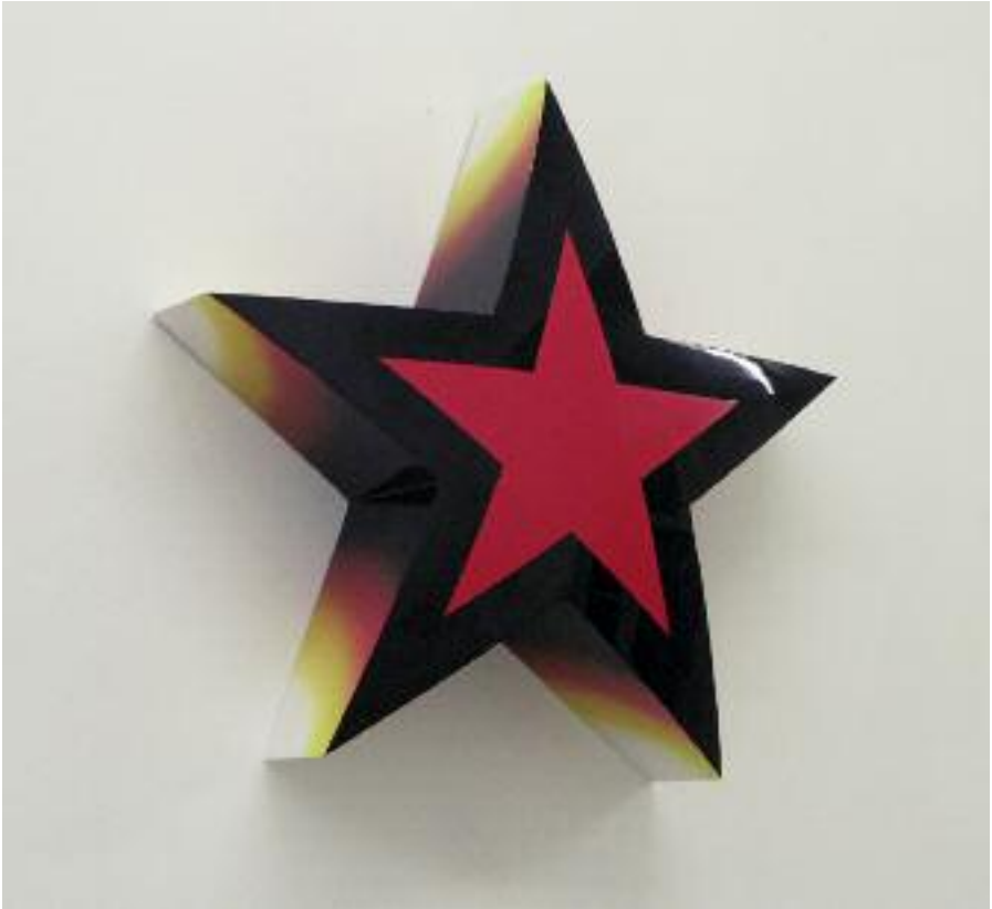
Pop Up , 2007, enamel on wood, 60 x 60 x 15 cm

The common thread of Morgane Tschember's work here attains its utmost tension. Morgane Tschember pulls on the straight line, winding it into a cone – into a playful, ductile tube: an orange organ to which the viewer is irresistibly drawn. Morgane the fairy turns space into motionless time, like a suspended wave. At the same time, she pulls the thread of art history toward infinity, like a gold leaf that finally curls up on itself. But her String Theory is highly physical.