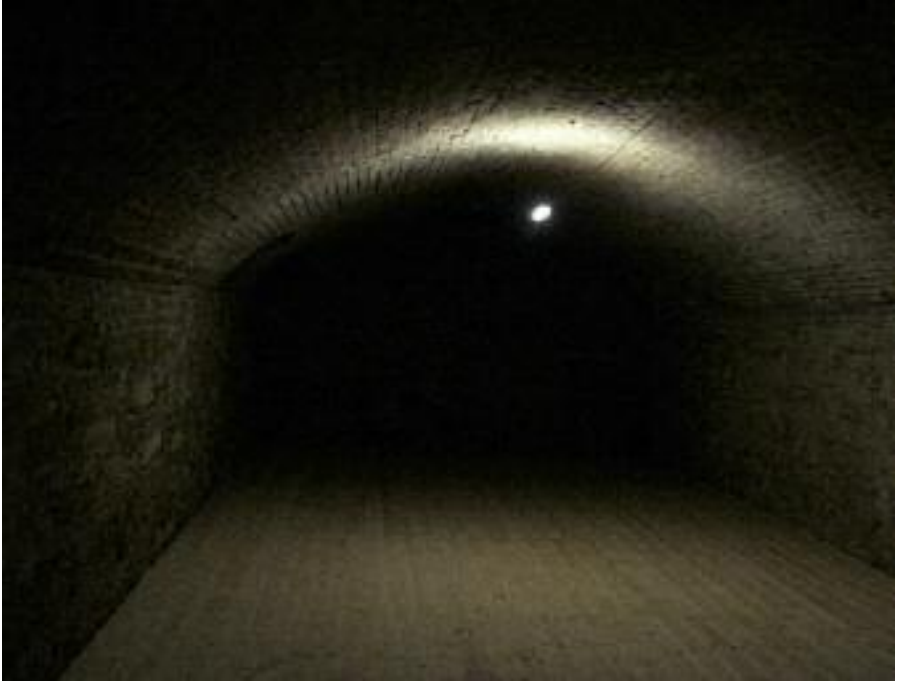
Ligne blanche , 2004, various materials, dimensions variable

White Line echoes another Claude Lévêque work, Ende (2001), which plunges the viewer into darkness, to the sound of Joe Dassin's » Et si tu n'existais pas « ( And if you didn't exist ) sung in fragile a cappella by the artist's mother.