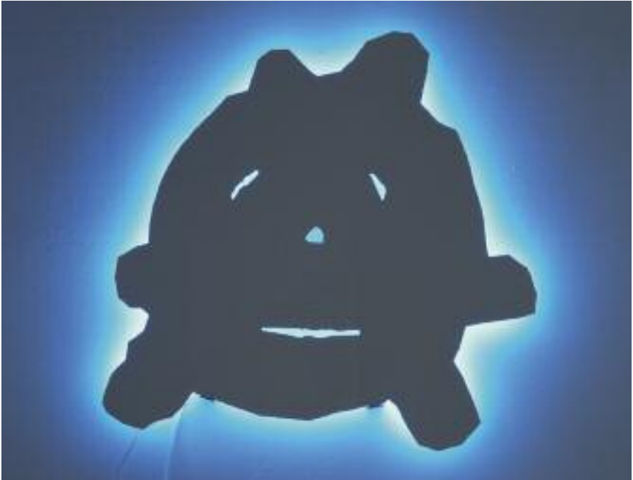
L'Auguste , 2007, aluminum and neon lamp, 120 x 120 cm

Bruno Peinado's artworks are untitled. They only have subtitles which offer other levels of interpretation: Untitled , The August . White neon lights draw a kind of graffiti. It is actually the A of anarchy, the political symbol hijacked by marketing and turned into a commercial logo. Looking at the work, a sad face crowned with light appears in negative. It is the face of The Auguste, the burlesque circus character, who is always in confrontation with the authoritarian Whiteface. The light intensity of the sculpture varies and makes these two images appear and disappear by juxtaposition. Untitled , California's custom game over. These metallic and gloss painted sculptures evoke a car's bodywork. The subtitle actually suggests the Californian atmosphere and custom body shop. The pure forms sketch lines which are assimilated with fluidity and sliding. But as we can see, the bottom of each sculpture is crashed. The mechanical power has been stopped at full speed: »game over«.