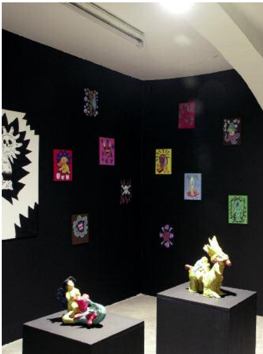
installation view: Fabien Verschaere, 2007