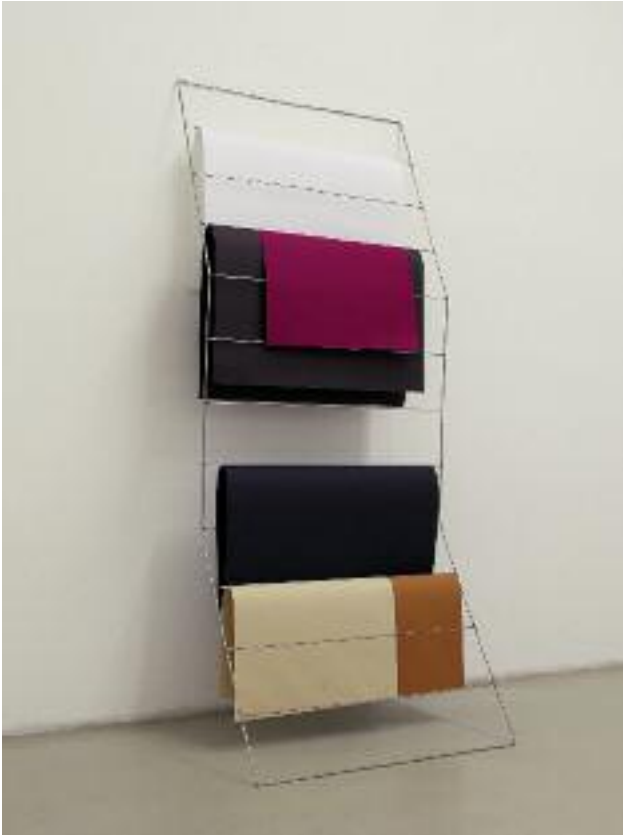
Rites à intervalles réguliers vertical , 2007, metal, paper, 180 x 80 cm, ed. 2 + 1 AP

Guillaume Leblon's work establishes a dialogue between modern, minimalist formal rigor and the sensuality of his everyday materials (glass, wood, felt, cardboard, paper...). He pays special attention to the spaces he encounters – be it unusual architecture, an exhibition venue, or his studio. This can be seen in the creation of spaces within space, with an approach that derives from delimiting, partitioning, and appropriating the venue; or in structures destined to reorganize the space by, say, creating rhythm and sequences.