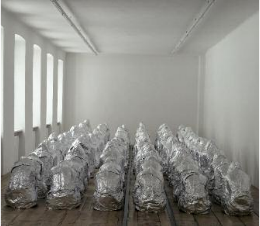
Ghost , 2007, aluminum foil, dimensions variable, ed. 3

Ghost is a variable dimensions installation, made of aluminum foil castings of women's bodies.