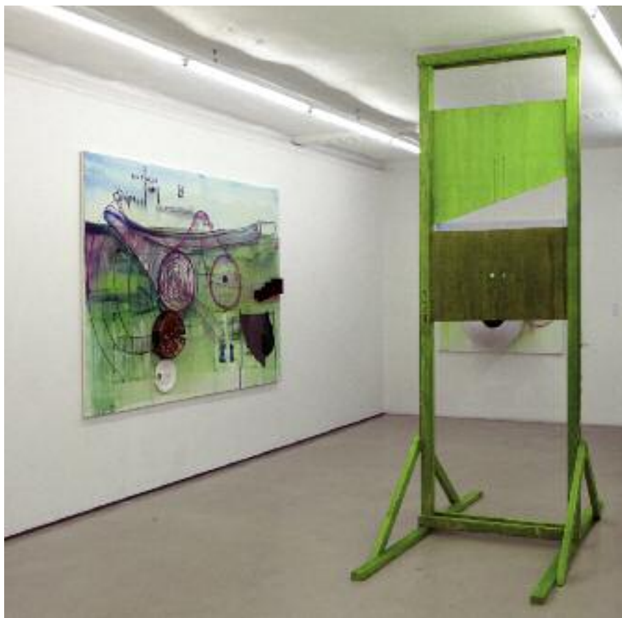
Alps revelation , 2007, mixed media on canvas, 150 x 280 cm N'View , 2007, wood, 300 x 200 x 100 cm

Moving works involves both transporting objects and translating a way of thinking. It does not take much to turn Austria into Ostrich, or a guillotine blade into the shutter of a lens. Europe makes a good nest for giant eggs with the right soldiers. – Fabrice Hyber, Paris, February 2008