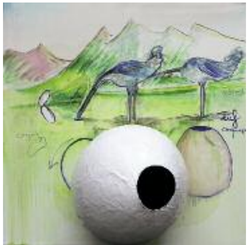
Revelation I , 2007, mixed media on canvas, 150 x 150 x 80 cm