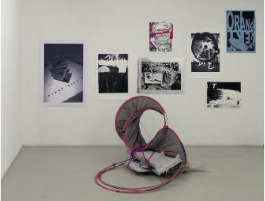
Installation view (for details see opposite page)

angle in what they term a »plastic investigation.« The narrative threads become entangled through shifts of focus, inversion, grid patterns and sliding from one form or matter to another. Forms have no value on their own account, but serve more as an indication, and as documentation, about an ensemble that is being built up; process and methodology are integral to the work. Hence their deliberately anti-monumental, non-erectile, unspectacular vision of sculptures and installations.